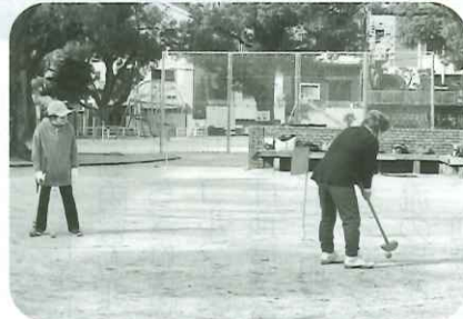
①グラウンド・ゴルフ