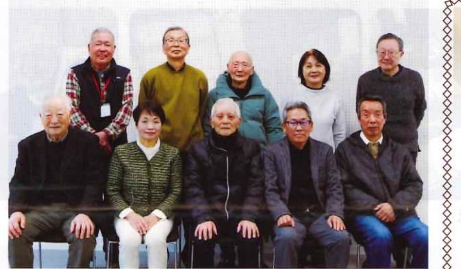
新クラブの皆さんと一緒にこれから頑張っていきます！

活動内容も非常に充実しており、ちぎり絵教室やグラウンド・ゴルフ大会、カラオケさらには地域の見守り活動などどれも参加者を楽しませ、つながりを深めるものばかり。特に交流の場としての役割が大きく、地域の高齢者にとっては、孤独を乗り越える大切な拠り所となっています。ここで得られる絆や笑顔は参加者にとつての生きがいでもありながら、クラブ運営に携わる役員の方々の喜びにもつながっています。