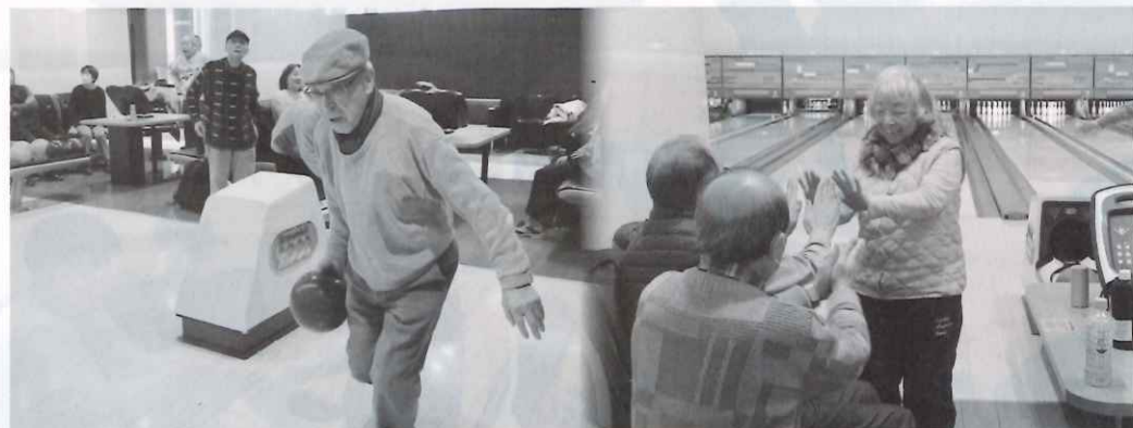
ナイスストライク！

その後ゲーム説明し各レーンに分かれゲーム開始。各レーンストライク、ガーターが出るたび歓声あふれ熱戦が広がる大会でした。競技の結果は左記になります。皆さん当日大変ご苦労様でした。ありがとうございました。