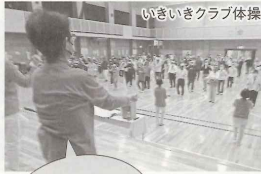
いきいきクラブ体操