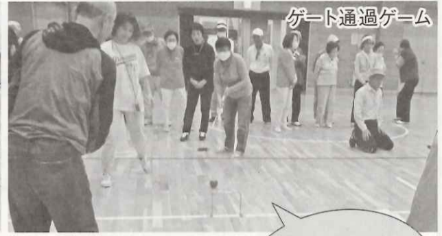
ゲート通過ゲーム