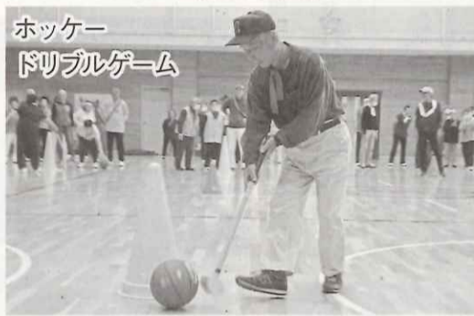
ホッケードリルゲーム