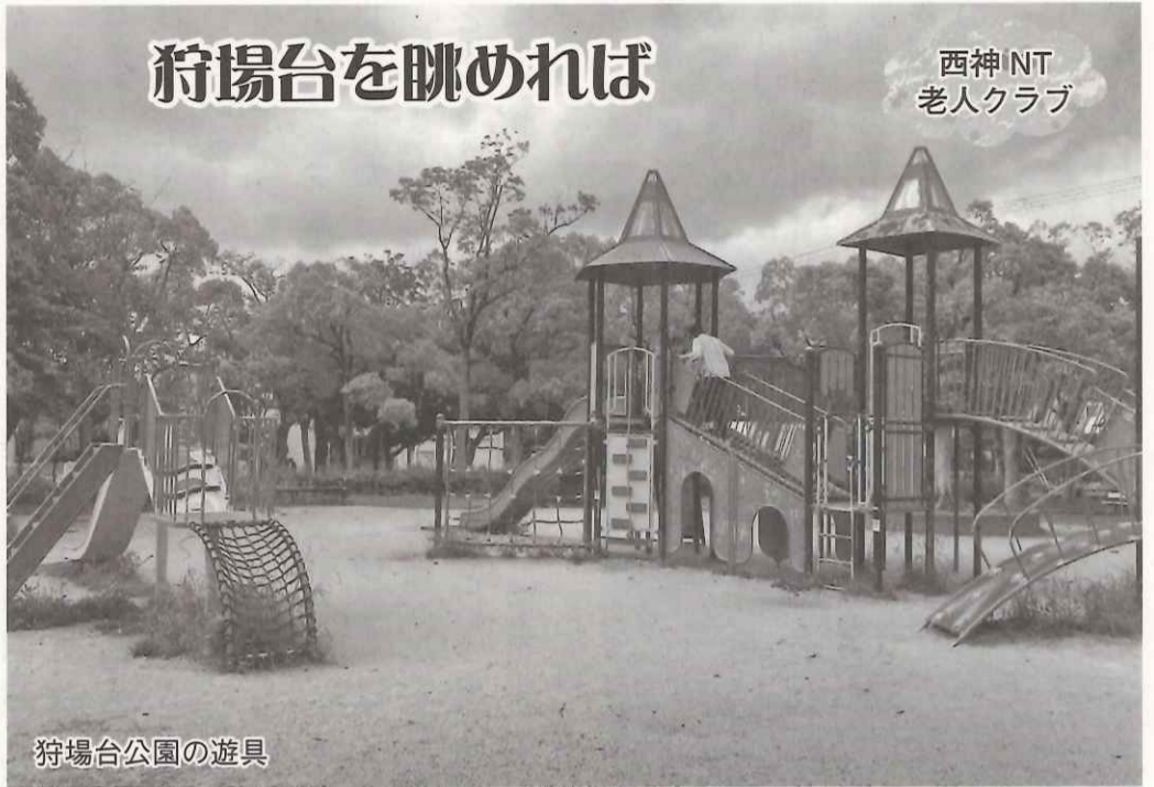
狩場台公園の遊具

狩場台は、西神ニュータウンとして丘陵地帯に住宅と産業を中心とする複合機能地区として開発され約40年が経過しました。狩場台という地名の由来として、昔は山奥で当時の明石城主や樫谷城主の狩りの場であったと伝えられています。