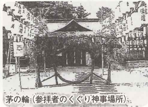
茅の輪(参拝者のくぐり神事場所)

7月27日(日)に行われまし た。16時~神事、18時~イ ベント・出店。萬燈祭は住 吉の大神様および氏子の皆 様ご先祖様に献灯して感謝 し、健康と繁栄を願って開 催される意義深い神事。茅 の輪をくぐり心身とも清々 しく明日に向かって行こう。