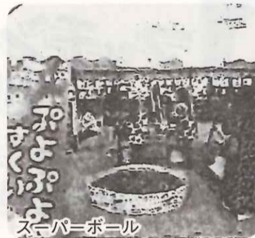
スーパースポール