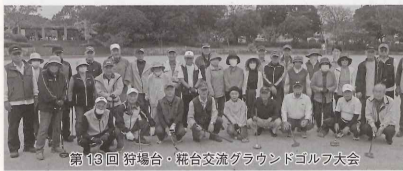
第13回 狩場台・梶台交流グラウンドゴルフ大会

唯一プレハブの仮設コートの店があるだけでした。その後、梶台小学校より分離して狩場台小。西には春日台小が創設されました。当初はまだ地下鉄もなく、名谷や明石からのバスが住民の足となっていました。昭和62年に地下鉄が通りました。狩場台地区も急激な人口増により小学校にプレハブ校舎も必要になりました。同時に春日台小近隣も人口増により学校分離が始まり新しい学校が次々と創設されました。