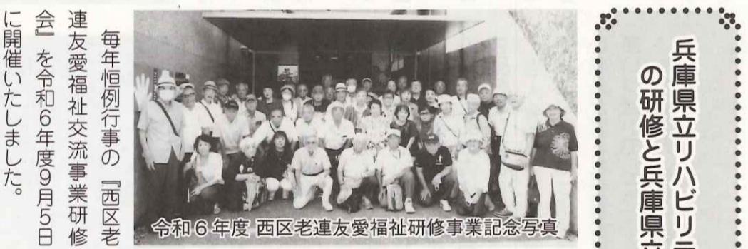
令和6年度 西区老連友愛福祉研修事業記念写真

毎年恒例行事の『西区老連友愛福祉交流事業研修会』を令和6年度9月5日に開催いたしました。本年度の予定は、8月30日に開催でしたが、台風の影響で各施設が受け入れ中止となり、当日に延期となりました。当日は立秋を過ぎたのに今年の酷暑が継続されているかのような酷暑の好天気になりました。開催日の延期により、約10名余りの参加者の変更があり、集合場所に48名が集合してくれるか心配をしましたが、各協議会の方々協力で無事全員が揃い、主催者側として安堵し、参加者の皆さま方に感謝したところでです。