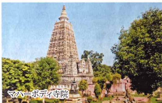
マハーボディ寺院