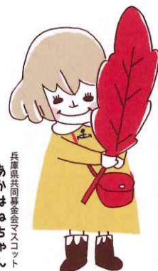
兵庫県共同募金マスコット あかはねちゃん

社会福祉法人兵庫県共同募金会 神戸市垂水区共同募金委員会 TEL.708-5151内線358