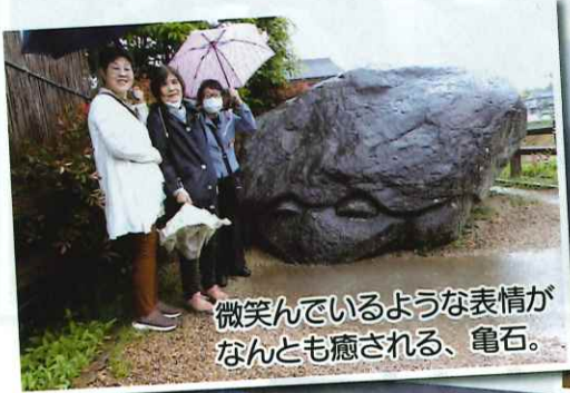
微笑んでいるような表情が なんとも癒される、亀石。