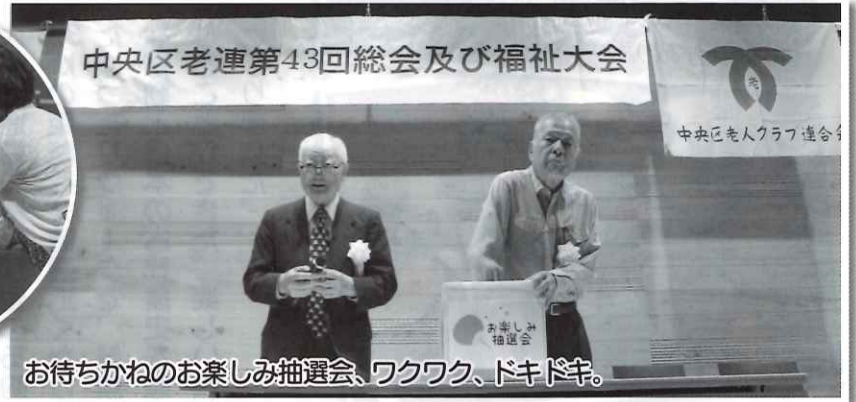
お待ちかねのお楽しみ抽選会、ワクワク、ドキドキ。