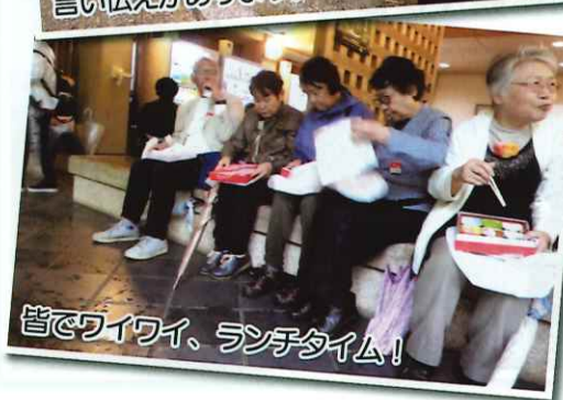
皆でワイワイ、ランチタイム!