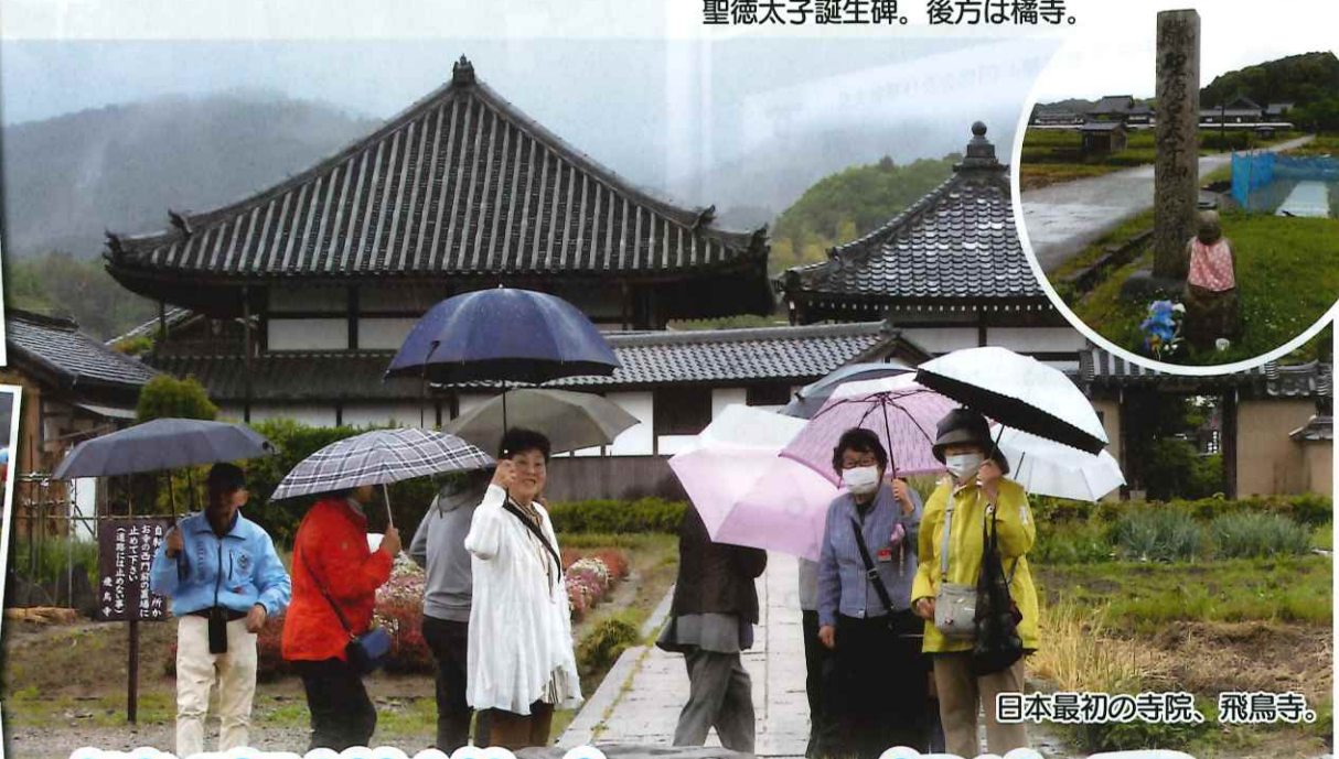
日本最初の寺院、飛鳥寺。