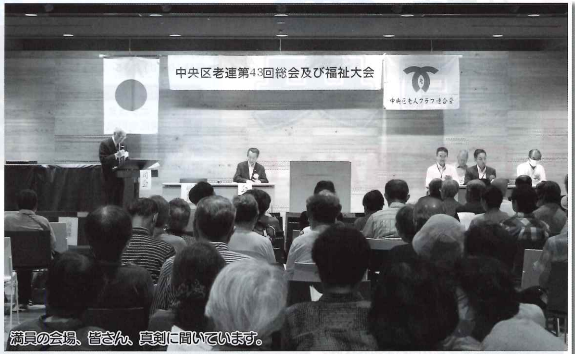
満員の会場、皆さん、真剣に聞いています。