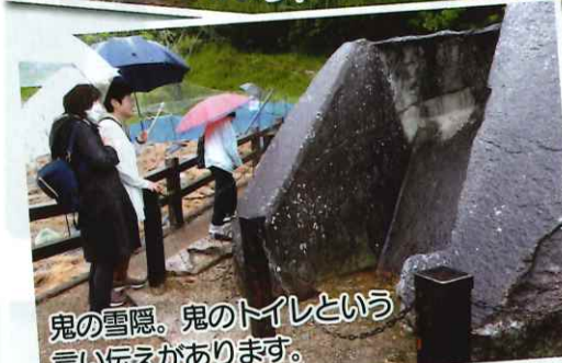
鬼の雪隠。鬼のトイレという 言い伝えがあります。