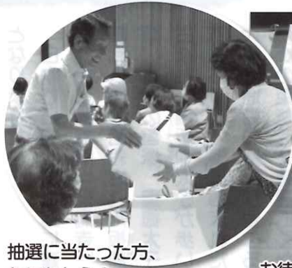
抽選に当たった方、なにかしら?