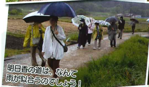
明日香の道は、なんて 雨が似合うのでしょうか!