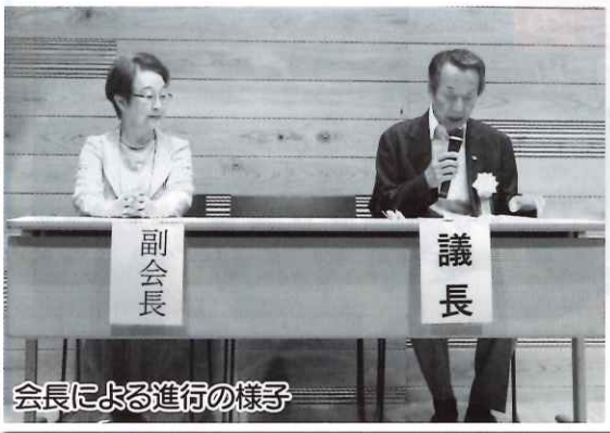
会長による進行の様子