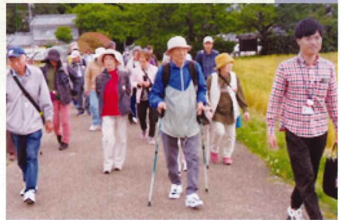
明日香路をウオーク