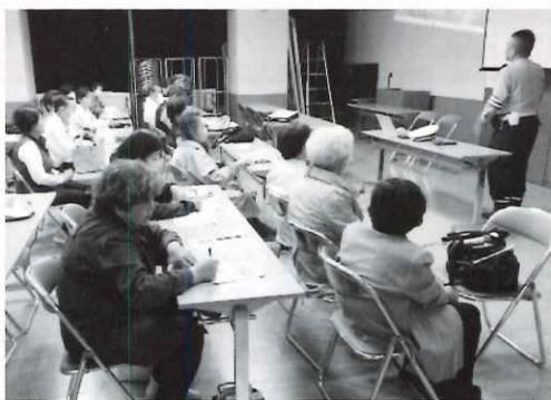
長田警察 特殊詐欺に注意と講演

命をのばす体操を繰り広げており、区内で合計15カ所での開催となっています。これらを運営するスタッフにも限界があり、区老連での他の行事の他、スタッフが所属するクラブでの諸活動があります。仮に、