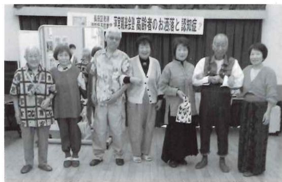
蓮宮親楽会 お洒落で盛り上がる

月に一度参加したからといって、体力増強や知識が増えたという即効果があるとは思いません。区老連の進める活動は、孤独や孤立する高齢者たちが、「仲間づくり」を行う「きつかけづくり」だと考えて下さい。私たち高齢者にとって脳の活性化を行うことが、認知症予防となり、健康寿命を伸ばすことに繋がっていきます。出かけて誰かと会話をすることが大切になっていきます。