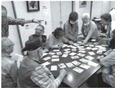
真野シルバークラブ 面白カルタ

認知症予防の教室も令和6年度に入り、既存の6地域に加え新たに真野シルバークラブ塾、番町塾（希望クラブ・第一永寿会・第二永寿会・つばみ会）、真陽寿倶楽部塾、蓮宮親楽会塾が参加。11地域22クラブが参加する体制となりました。長田区老連では、この他にも毎月4カ所の会場で健康寿