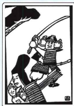
■長田区役所「長田の歴史」から挿絵は「丘あつし」氏

て主戦場になり、民家などが焼かれてしまったと思われる。南北朝時代にも、合戦の場となり、長田神社は湊川合戦で足利方についた。そして、明治に至るまで、農村地域としてそれぞれの地域は発展してきたのである。