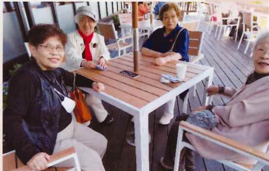
くつろぐ参加者のみなさん

5月18日(月)、長田区老連春のバス旅行が福井県三方五湖観光として実施(130名バス3台)綾部市バラ園、風光明媚な三方五湖を訪れ、楽しむことができました。