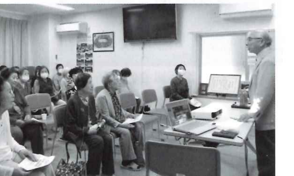
高齢者の現状報告に聴き入る真陽寿倶楽部の皆さん