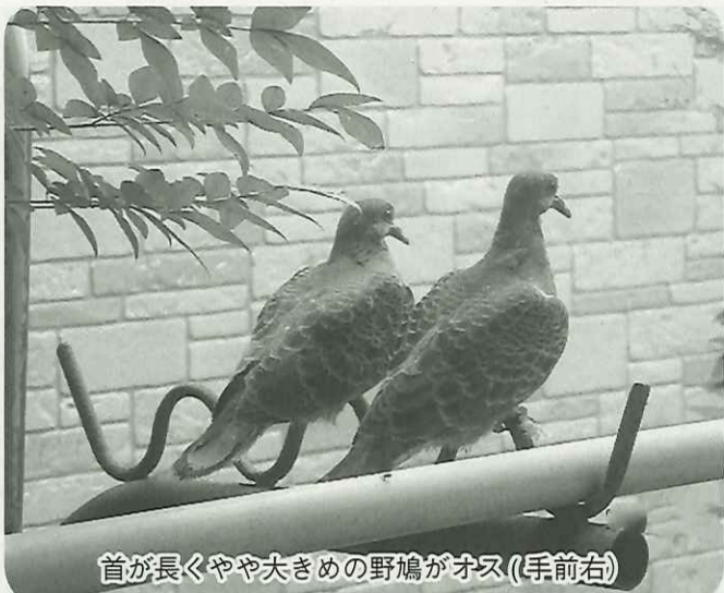
首が長くやや大きめの野鳩がオス(手前右)

例のタオルを今度は、西の部屋の窓から南天の樹の枝の張った丈夫そうな窪みに、タオルを二重にして敷いてやったそうです。