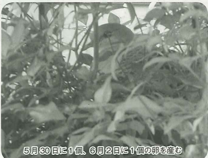
5月30日に1個、6月2日に1個の卵を産む