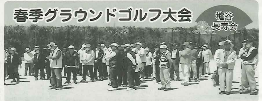
春季グラウンドゴルフ大会

コロナと雨で3年間中止となり4年振りの大会です。歓声と拍手と笑顔の絶えないひとときでした。終