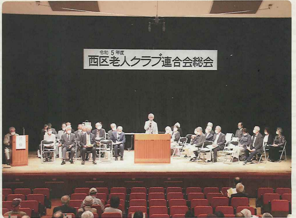
令和5年度 西区老人クラブ連合会総会

5月23日(火)、神戸市立西区文化センター大ホールにおいて令和5年度神戸市西区老人クラブ連合会総会が開催されました。