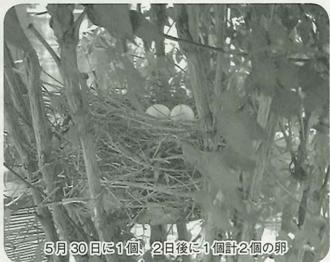
5月30日に1個、2日後に1個計2個の卵

2羽の親鳥が、せっせとタオルの上に枯れ枝を運び込み、嘴と足の爪を巧みに使って、固く丸くそれは器用に巣の基礎を作ります。最後は、巣の中に2羽が入りお互いに毛繕い、親鳥自らの柔らかな抜けた羽毛を敷き詰めて巣が完成です。