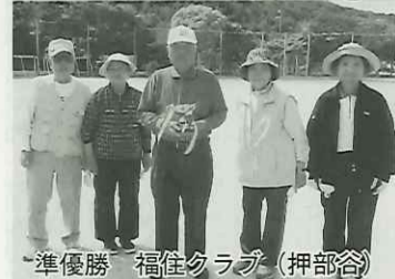
準優勝 福住クラブ(押部谷)

います。やはりチーム数が多いと活気があり盛り上がりです。回数を重ねることに参加チームが増えることを願っております。皆さまのご協力をお願いいたします。準備怠りなく楽しみに致しております。