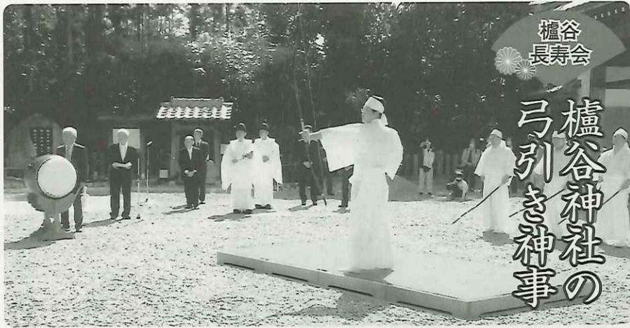
櫛谷長寿会 櫛谷神社の 弓引き神事

令和5年3月12日(日)、西区櫛谷町福谷にある櫛谷神社にて弓引きの神事が行われました。青天の下、友清集落より2名、福谷集落より3名の射手が20m先の矢の的に向かって五穀豊穡と集落の平安を願い矢を射りました。次々と矢が的に命中すると大太鼓が鳴り拍手喝采で大盛り上がりが続きました。弓引きの神事は滞りなく終了し、今年