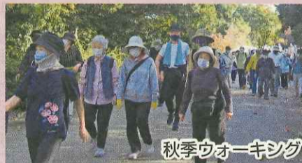
秋季ウォーキング