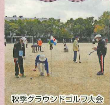
秋季グラウンドゴルフ大会