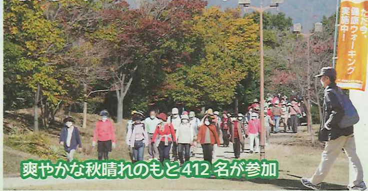
爽やかな秋晴れのもと412名が参加

11月19日(木)、区老連主催の秋の ウォーキング大会が開催され、412 名が参加しました。