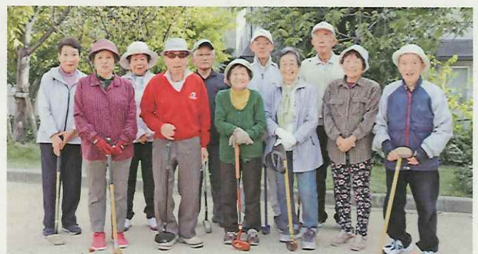
集合写真撮影のみマスクを外していただきました

「お日さんにあたって、みんなと一緒にプレーしていると体に良いわ」「スコアをつけるのも頭も使うし、ポケ防止にも最適だね」と笑顔で練習に励む皆さん。コロナ禍でもマスク着用や手指消毒など、対策をとりつつ、仲間との交流のひとときを楽しんでいます。